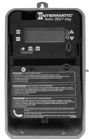
Représentée sous boîtier métallique verrouillable intérieur/extérieur

Veiller à suivre ces instructions pour effectuer l'installation et la programmation de la minuterie ET2815.