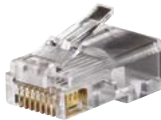
VDV826-603 (CAT 6)