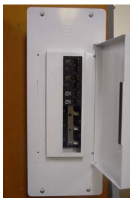
Étape 3 Installez le nouveau HFCLCI