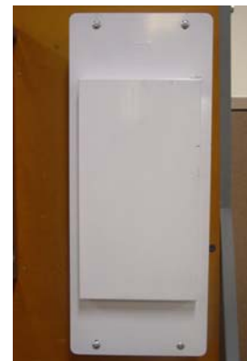
Étape 4 Terminez l'installation

Les tableaux de répartition encastrables à fusibles Homeline (HFCLCI) offrent la sécurité et la fiabilité d'un système de répartition à disjoncteurs moderne utilisant des disjoncteurs Homeline. Remplace facilement les tableaux de répartition à fusibles désuets. Aucun trou à percer. Aucune nouvelle mise à la terre requise. Aucun conducteur de branchement ni conduit à enlever. L'utilisation des tableaux FLCI Homeline réduit grandement le temps d'installation, de plus de 80 %, ce qui permet un remplacement économique des vieux tableaux de répartition à fusibles.