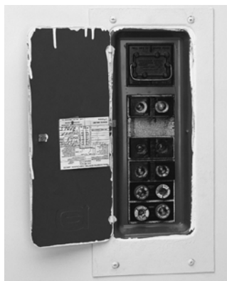
Étape 1 Identifiez les dimensions de la boîte et le numéro de catalogue

Tableaux de répartition encastrable à fusibles