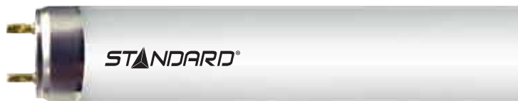
Longueur nominale : 48 po (915 mm) Dia. : 1 po (26 mm)

Code de commande : 65490 Description: F28T8/841HL/ES Code CUP : 69549654907 Quantité par caisse : 25