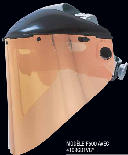
MODÈLE F500 AVEC 4199GDTVGY

Plaquée or pour utilisation dans des températures élevées – intérieur gris True-View